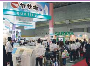
熱心な見学者が集まるメーカーさんのブース