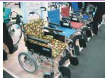
実際に見る機会が少ないカラフルな車いす