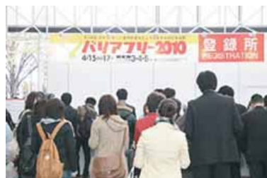
沢山の人が賑わう入場者受付です。

2010年4月15日～17日安心ライフ全社員でインテックス大阪で開催されたバリアフリー2010へ行ってきました。