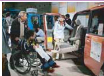
実車で移乗体験もできます。

この展示会には、車いすで簡単に乗降できる「自動車」から、沢山の用具が展示され、実際に手にとり試すことができます。今回は、この展示会で私が「便利！」と感じたモノをご紹介します。まだまだ試作段階の為、ご紹介できない用具も沢山ありましたので、製品化された折には、この広告や弊社の営業マンがお知らせ致しますので、ご期待ください。